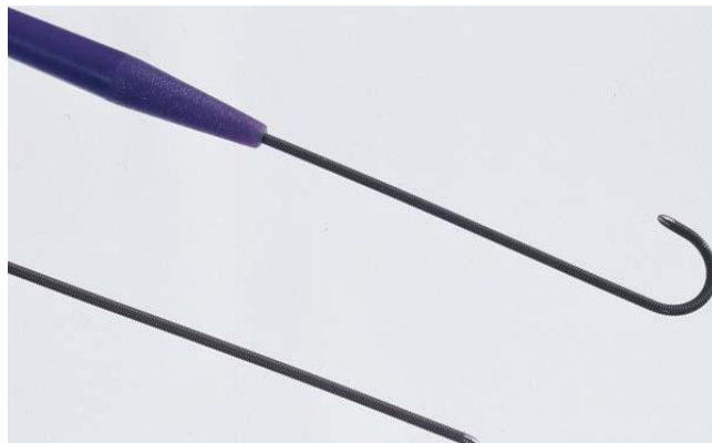
Obrázok 2: Nákres rovného vodiaceho drôtu, Standard s hrotom v tvare J a typu Bentson